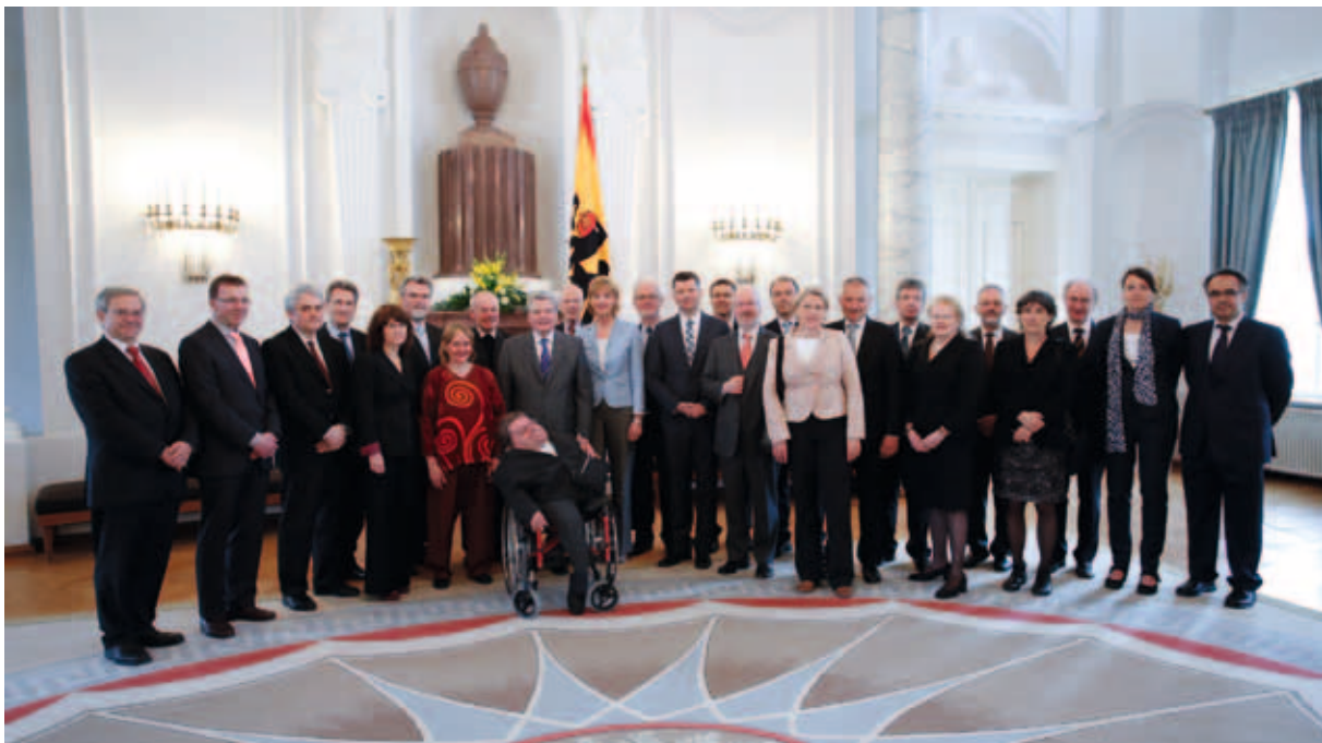
Bundespräsident Joachim Gauck und die Mitglieder des Deutschen Ethikrates während des Empfangs im Schloss Bellevue

Auch im zurückliegenden Geschäftsjahr hat der Ethikrat, vertreten durch