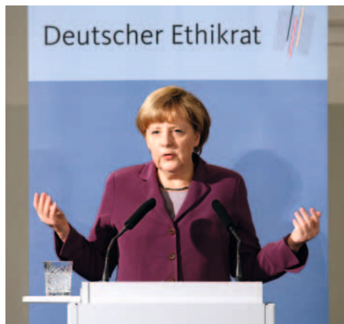
Bundeskanzlerin Angela Merkel beim Forum Bioethik in der Französischen Friedrichstadtkirche am Gendarmenmarkt

Entgegen seiner bisherigen Praxis, die Bundestagsabgeordneten im Rahmen von parlamentarischen Abenden über die Arbeit des Ethikrates zu informieren und diesen Gelegenheit zu einem direkten Austausch zu geben, hat der Deutsche Ethikrat im Jahr 2013 mit Blick auf die Neubesetzung des Deutschen Bundestages nach der Bundestagswahl im September auf die Durchführung eines parlamentarischen Abends verzichtet.