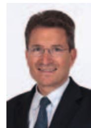
Prof. Dr. theol. Dr. h. c. Wolfgang Huber, Bischof a. D.