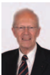
Prof. em. Dr. iur. Edzard Schmidt- Jortzig, Bundes- minister a. D.