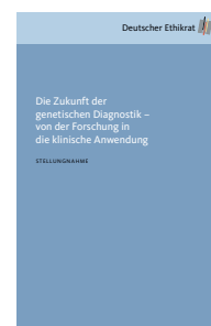
Deutscher Ethikrat (Hg.): Die Zukunft der genetischen Diagnostik – von der Forschung in die klinische Anwendung. Berlin, 2013 (ISBN 978-3-941957-44-2)

Aus der großen Menge an genetischen Daten werden durch verschiedene Auswertungen Befunde mit unterschiedlicher Bedeutung erhoben: Manche sind für die medizinische Versorgung sehr hilfreich, andere erbringen belastende Informationen ohne Eingriffsmöglichkeit, wieder andere sind von unklarer Relevanz. Die Gefahr von Fehlinterpretationen und Missverständnissen ist groß, wenn